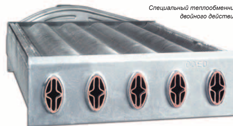
Специальный теплообменник двойного действия